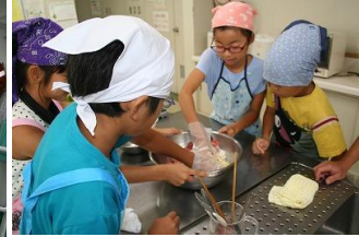
お家の人の お手伝いをしよう！ 子ども料理教室