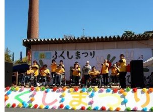
皆が安心して暮らせる町へー みんなの願いをひとつに。 ふくしまつり