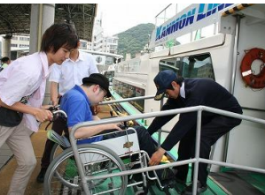
みんなで行こう！！ ふれあい列車の旅 フレンドシップツアー