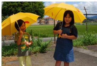
新1年生に赤い羽根黄色い傘のプレゼント