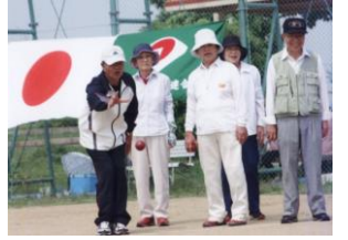
いつまでもお元気で！ 老人クラブの皆様のスーツ推進