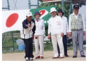
いつまでもお元気で！ 老人クラブの皆様の スポーツ推進