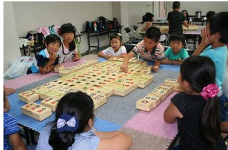
私たちの町の ふくしについて考えよう ボランティアスクール