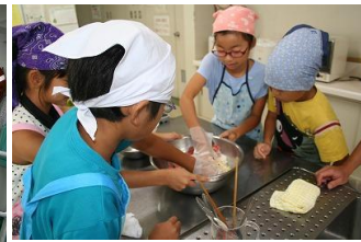
お家の人のお手伝いをしよう！ 子ども料理教室