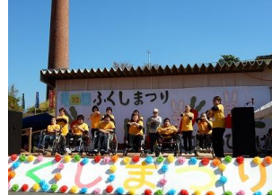
「皆が安心して暮らせる町へ」 みんなの願いをひとつに。 ふくしまつり