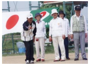
いつまでもお元気で！ 老人クラブの皆様のスーツ推進