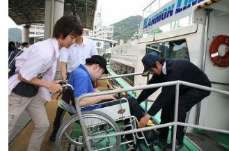
みんなで行こう！！ ふれあい列車の旅 フレンドシップツアー